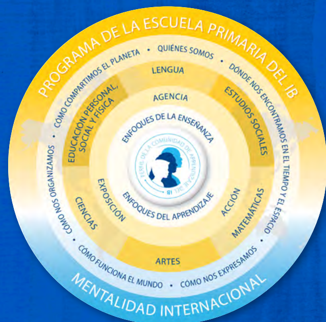
Versión revisada del modelo del programa (borrador)