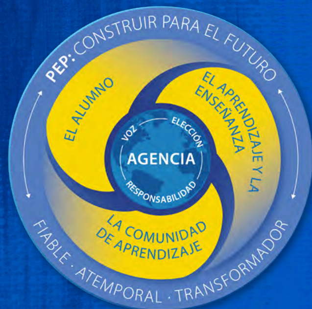
Nueva estructura organizativa del programa